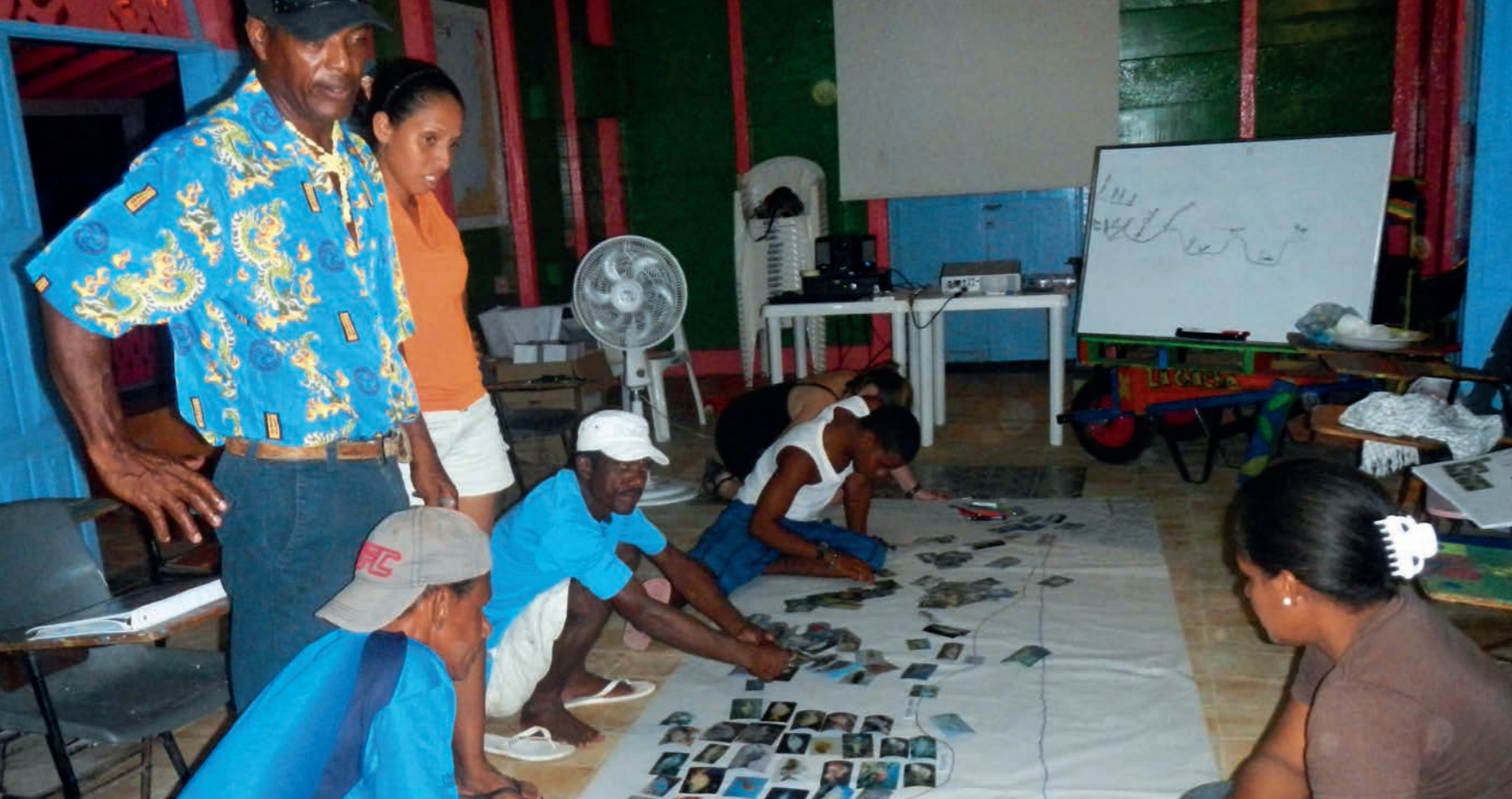
Construyendo un perfil submarino