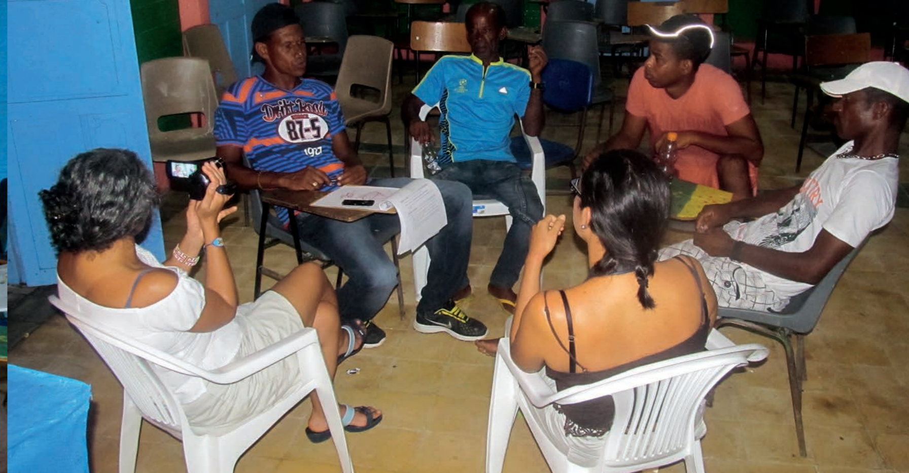
Los autores conversando sobre la pesca en Barú

ejemplo, con la norma de no coger los recursos marinos: si me ven a mí haciéndolo, me regañan: ‘Tú no puedes hacer esto’, y así el uno al otro, de esta forma se continúa hasta formar una red. Esa red puede funcionar si nos vamos a respetar. Así se va dando y cuando nos demos cuenta todos estaremos unidos bajo los principios del respeto y el diálogo argumentado”. (*)