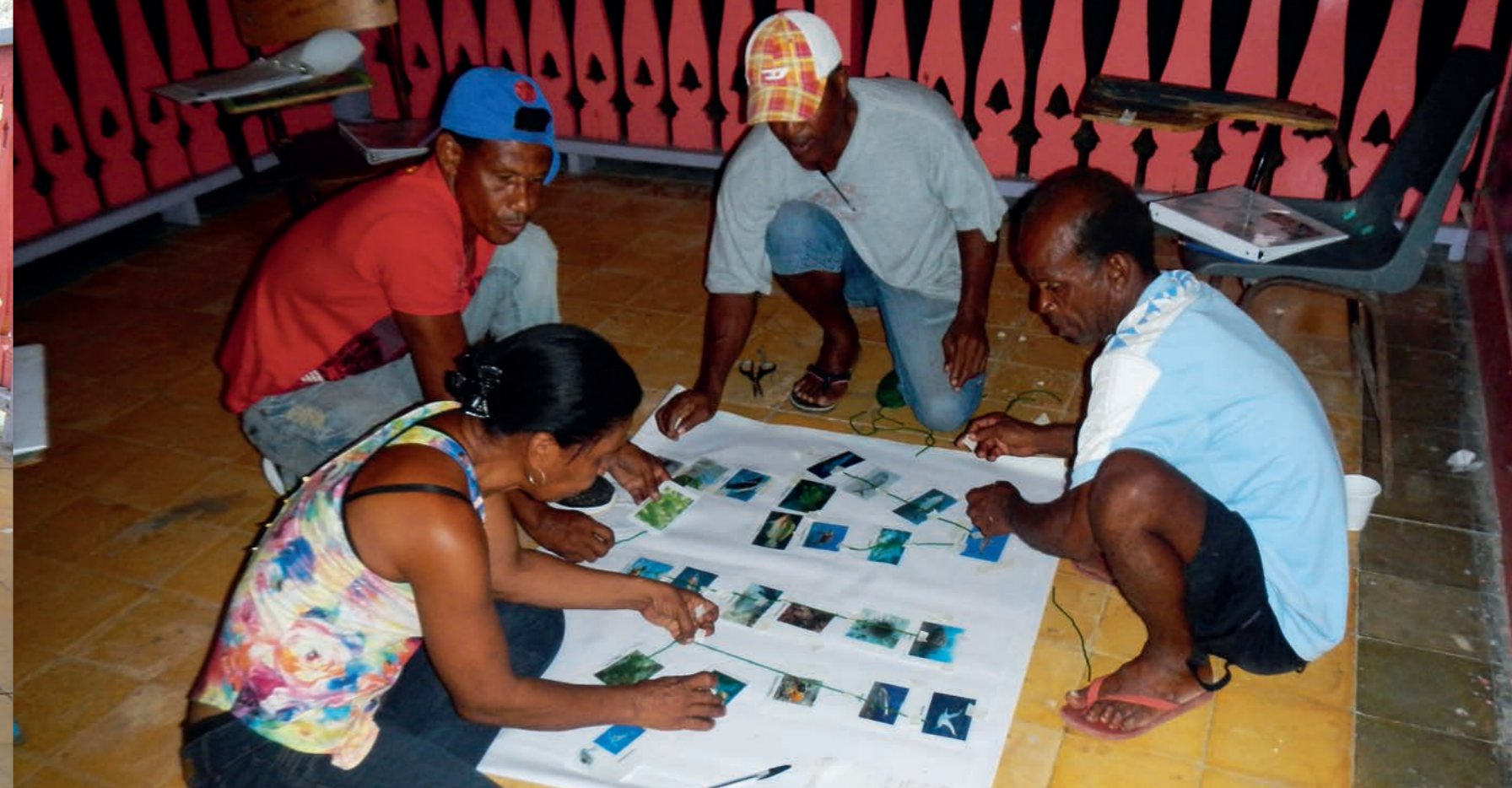
Trabajando sobre la red trófica

“Hay que cambiar la forma como se están dando las cosas. Como comunidad hay que hacer un ejercicio interno de apropiación de nuestro territorio, de lo que tenemos, de nuestro recurso. Que la gente despierte, que adopte un sentido de pertenencia, que sea capaz de defender, de pelear, de regañar, de pararse en la raya para decir: ‘¡Oiga, ya no más!’. Y eso se logra si nosotros nos organizamos.