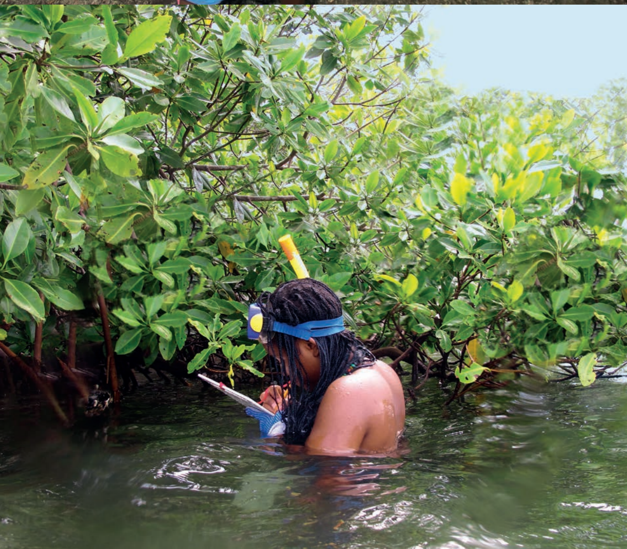
Joven barulera tomando datos biológicos

“Tú estás diciendo eso porque estás aprendiendo que eso hace daño, pero muchos pescadores pueden hablarlo y no cumplirlo. Nosotros, los que estamos aquí estudiando, como pescadores podemos cumplir. Eso ya lo aprendimos y vamos siendo conscientes de lo que estamos hablando. Ya prácticamente no podemos actuar de otra manera, pero muchos pescadores que no vienen a capacitarse hacen y deshacen. Así esa fauna nunca se va a conservar porque los que la queremos conservar, la conservamos, pero otros la están dañando por otros lados”. (*)