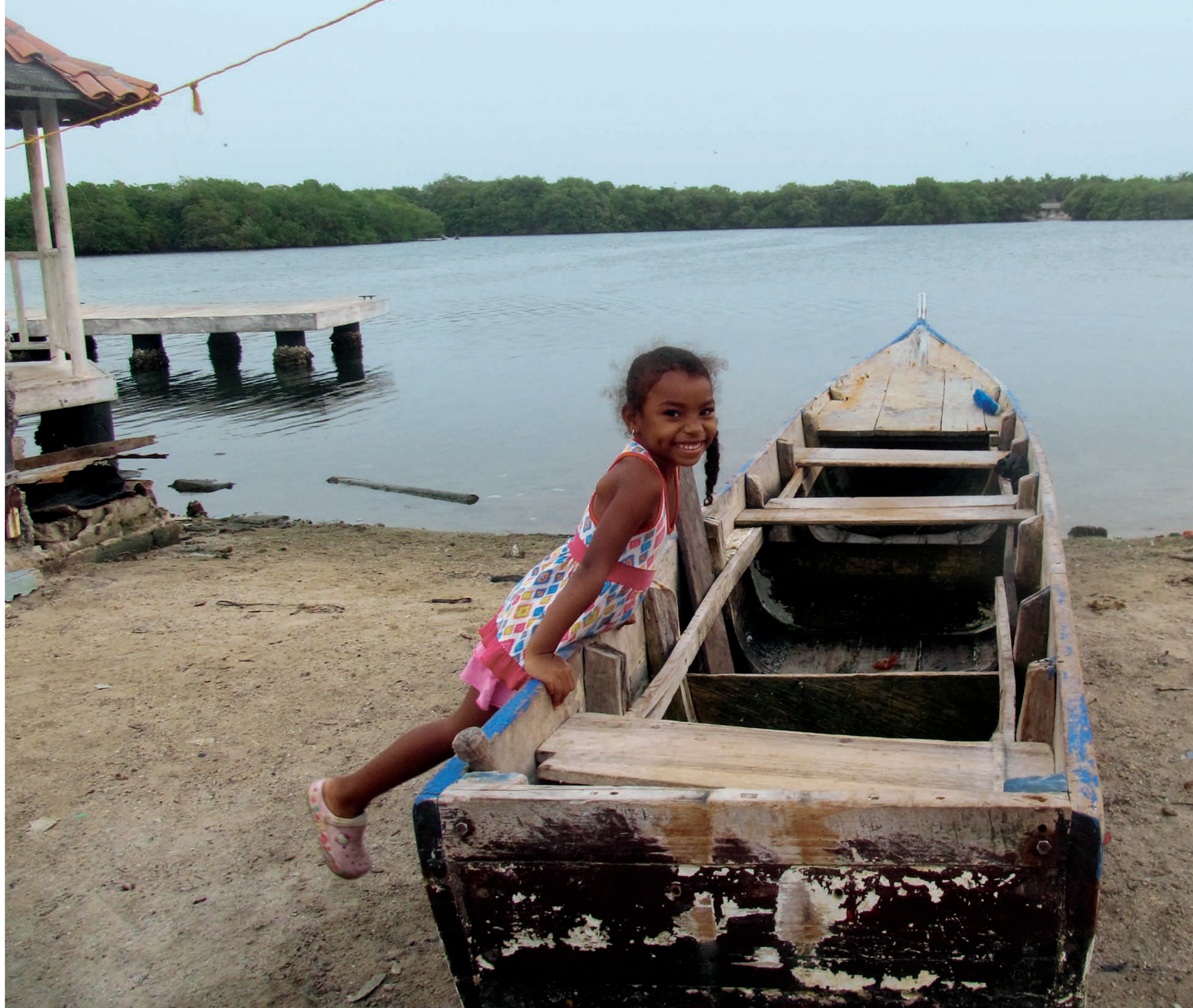
Niña barulera en bote de madera

"Nosotros tenemos que empezar a apropiarnos del recurso que tenemos y a quererlo. Es que no solamente somos dueños cuando pescamos: debemos proteger lo que tenemos, llamar a las autoridades ambientales y decirles: 'Oigan, nosotros tenemos toda la intención de conservar tal cosa, pero también queremos que ustedes estén involucrados en la tarea de conservación porque ustedes también tienen una misión que cumplir'. Entonces deberían empezar a implementar esos acuerdos que permitan la participación de los dos, para el ejercicio de la conservación". (*)