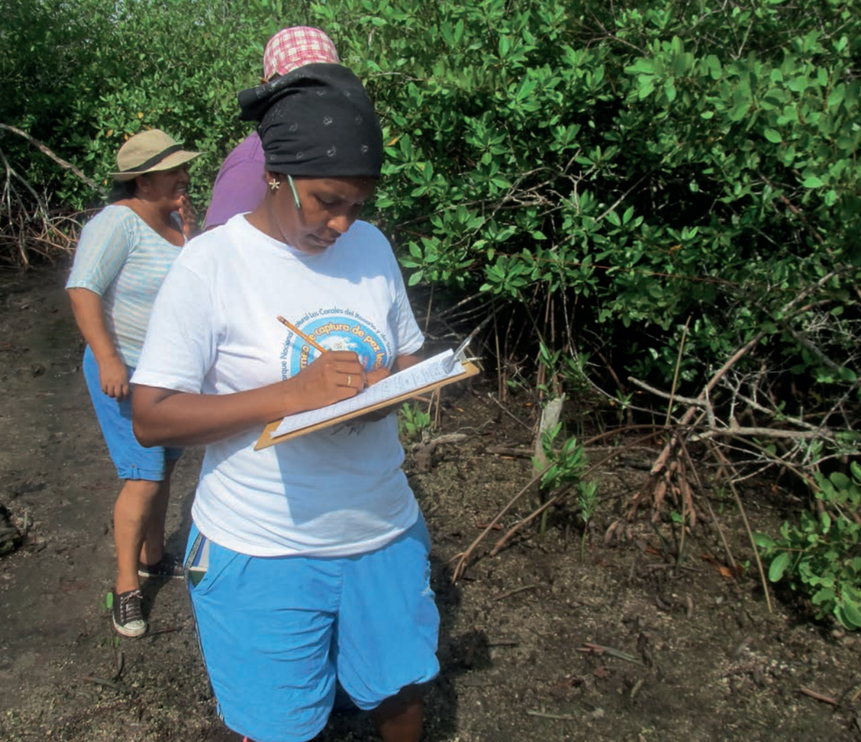
En salida de campo: identificación de las especies de manglar en Barú