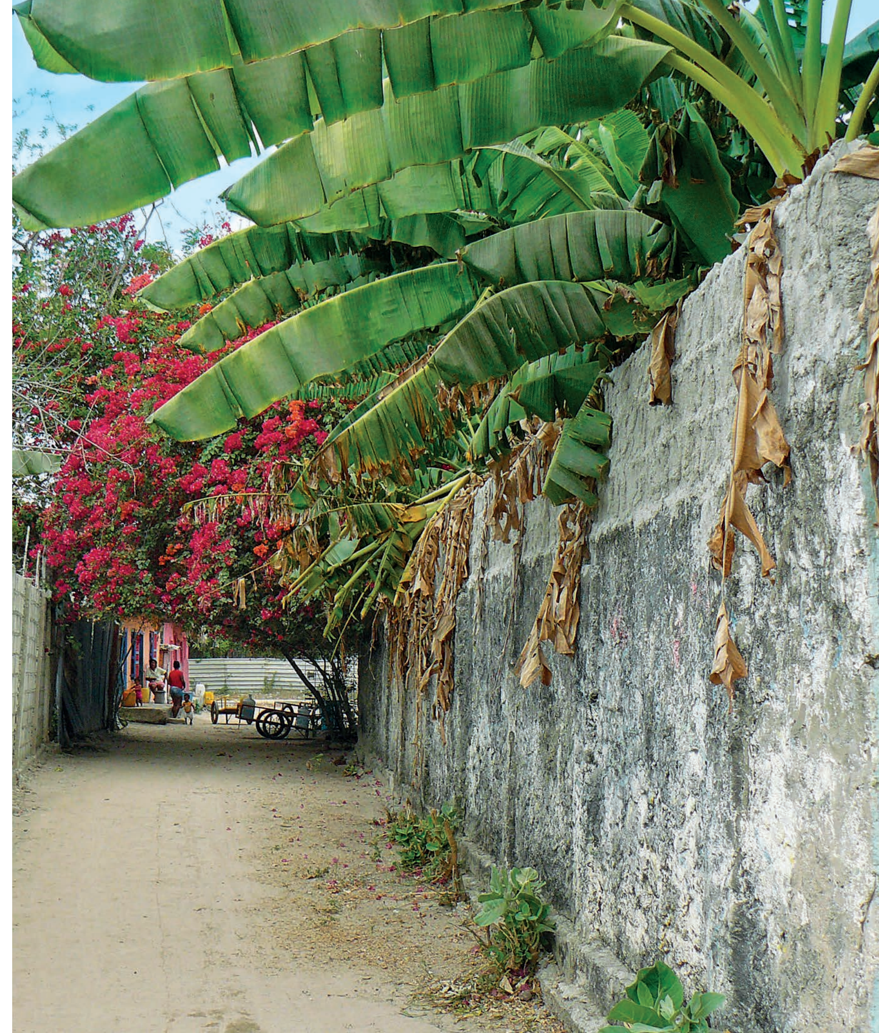
Calle de Barú con flores