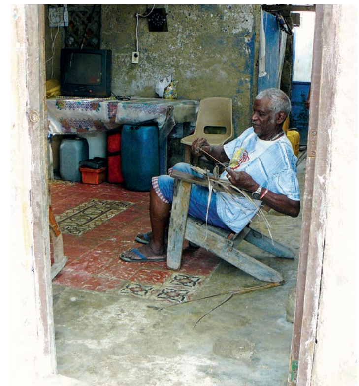
Artesano trabajando con la fibra del árbol del corozo

El servicio de educación es brindado por la Institución Educativa Luis Felipe Cabrera, que atiende a un total de 823 niños: 70 en preescolar y 753 en los grados primero a once.