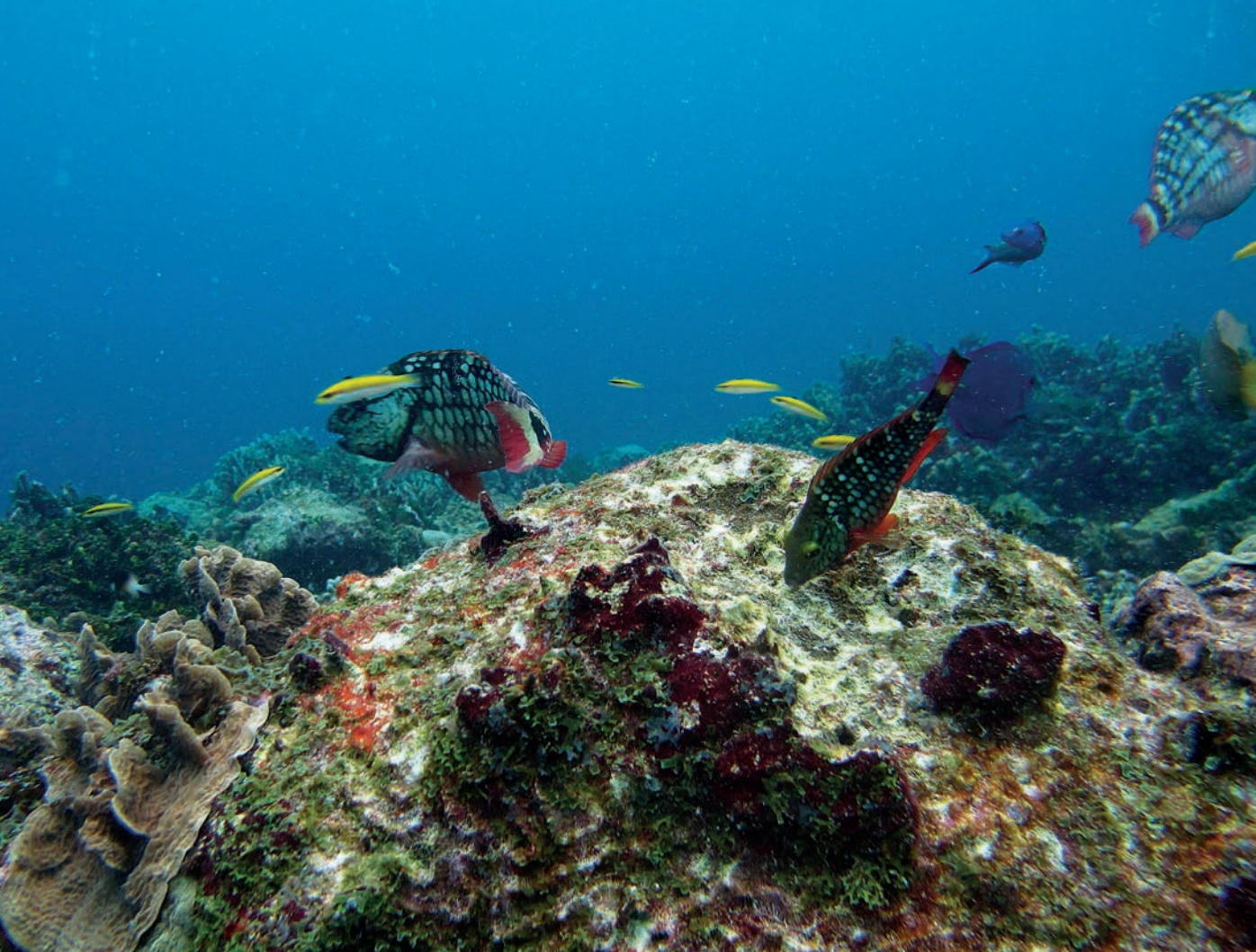
Un acuario en la profundidad