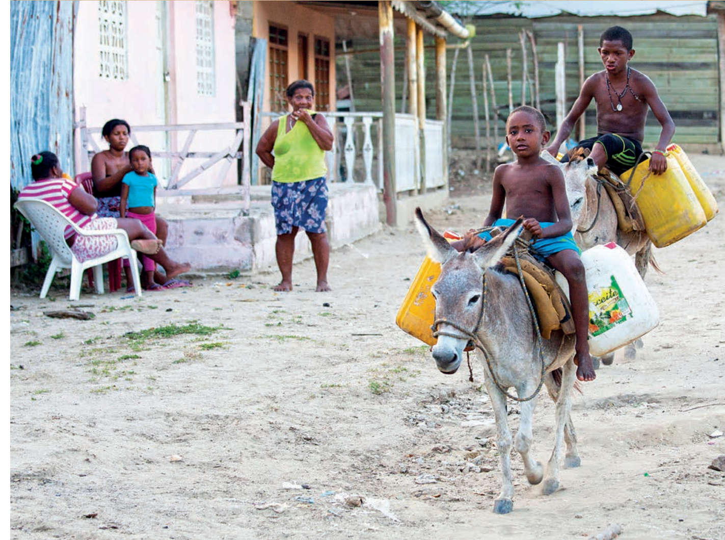
Niños en burro cargando agua