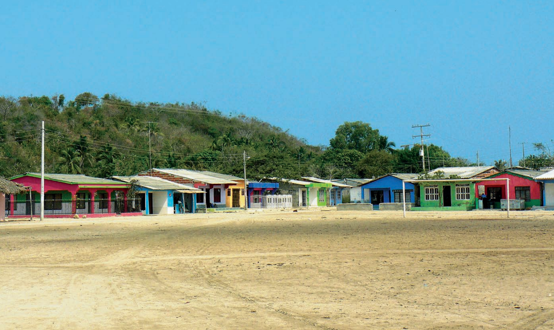
Cancha de fútbol en la Plaza del Triunfo