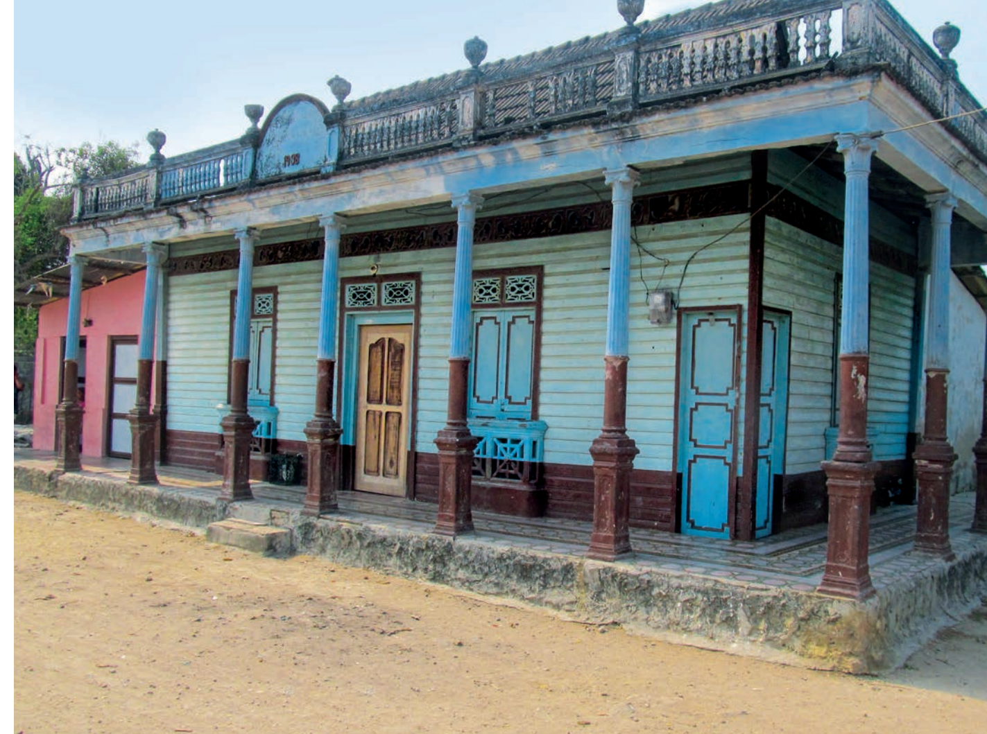
Arquitectura tradicional barulera