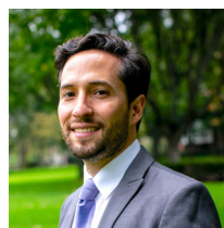
Juan Sebastián Galán

El Centro de Datos del CEDE –CD– en 2019 realizó el lanzamiento de la nueva APP Datos CEDE , la cual es un repositorio de datos del país. Esto tiene el objetivo tanto de ampliar acceso libre y gratuito a datos