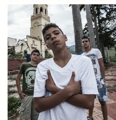
Autor: Lina María Arias 1

En el marco de continuar mostrando la valiosa información con la que cuenta el CEDE en su Centro de Datos, este boletín tiene como objetivo presentar un análisis descriptivo de la base de datos del programa de transferencias condicionales Jóvenes en Acción. El programa está dirigido a los jóvenes entre los 16 y 24 años que necesitan apoyo del Gobierno para continuar sus estudios técnicos, tecnológicos y profesionales, siempre y cuando cumplan los requisitos exigidos por este DANE, p. 8, 2017.