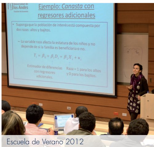
Escuela de Verano 2012