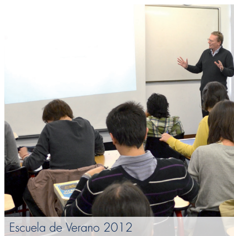
Escuela de Verano 2012