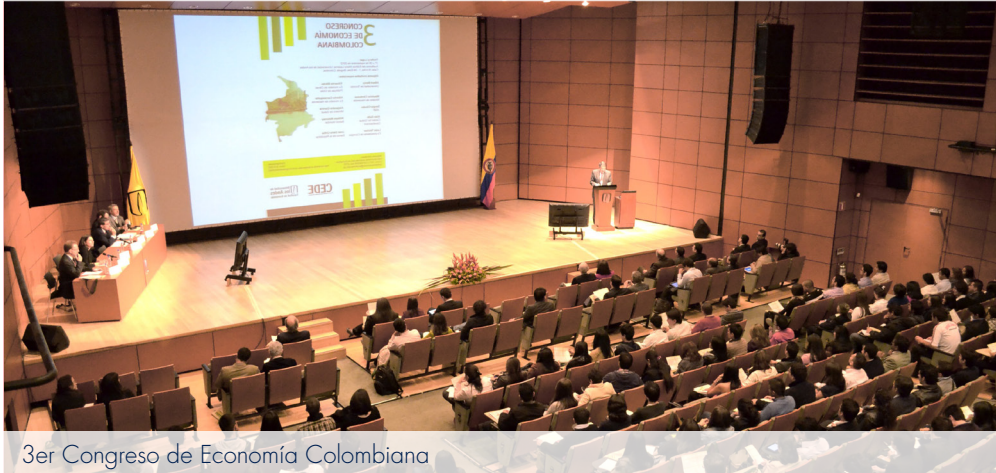
3er Congreso de Economía Colombiana