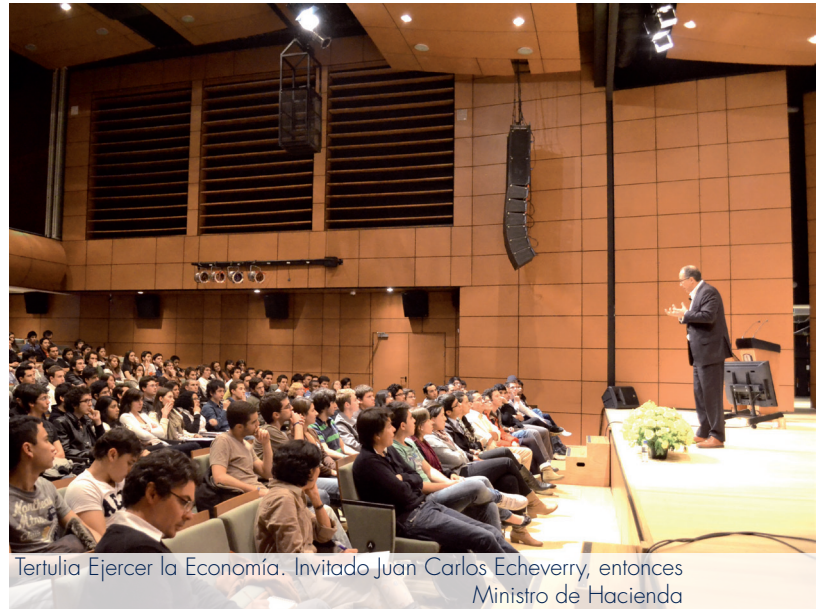
Tertulia Ejercer la Economía. Invitado Juan Carlos Echeverry, entonces Ministro de Hacienda