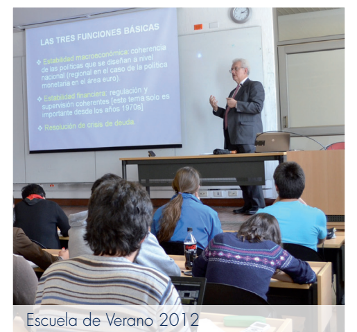
Escuela de Verano 2012