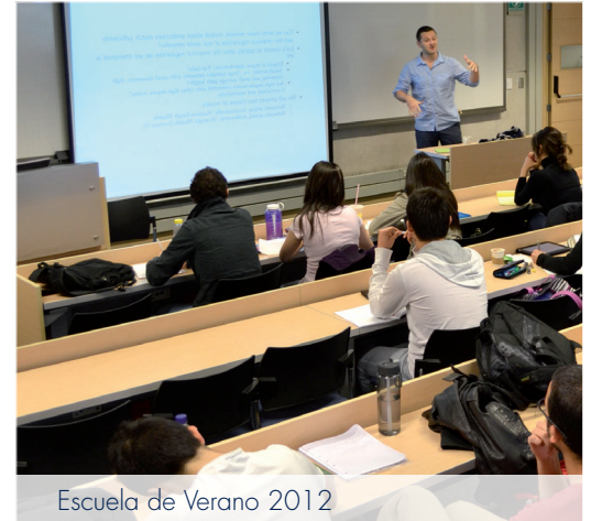
Escuela de Verano 2012