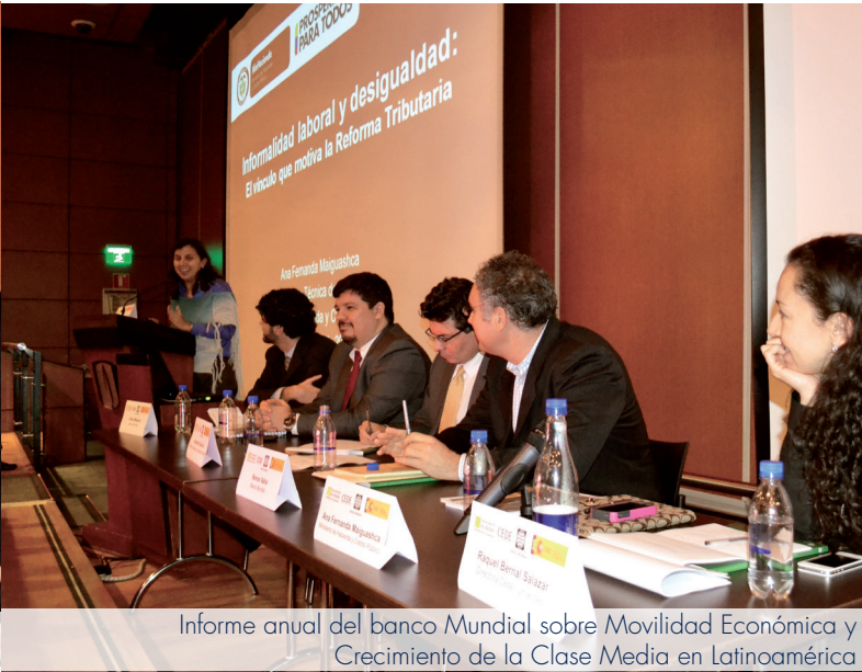
Informe anual del banco Mundial sobre Movilidad Económica y Crecimiento de la Clase Media en Latinoamérica