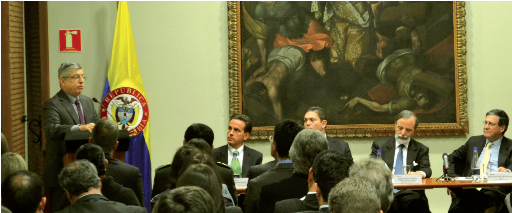
Lanzamiento del Centro de Estudios sobre Seguridad y Drogas (CESED)