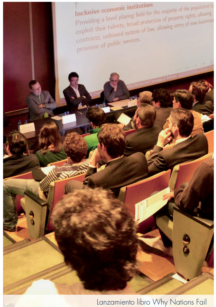
Lanzamiento libro Why Nations Fail